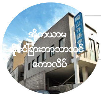
ပညာဆက်လက်သင်ယူခြင်း